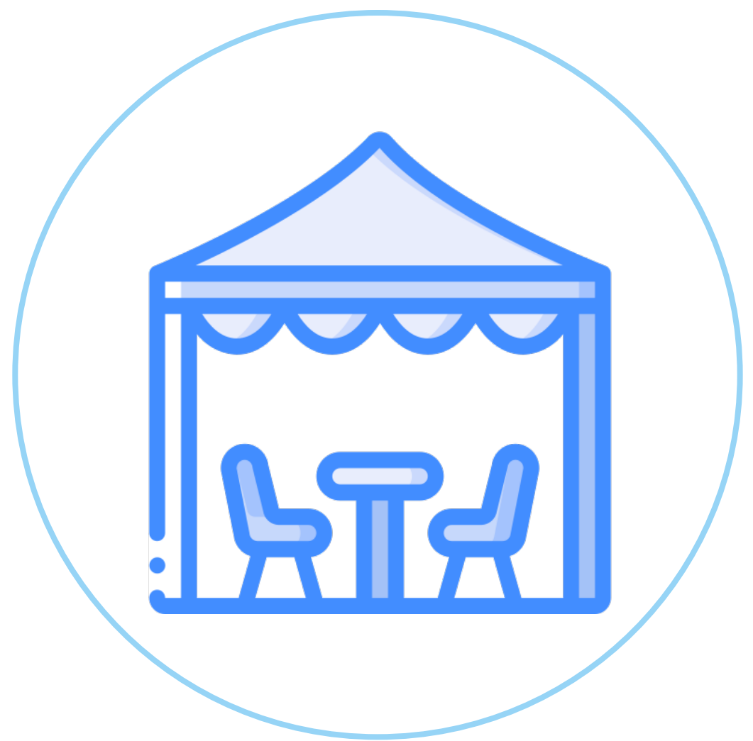
Gazebo all day