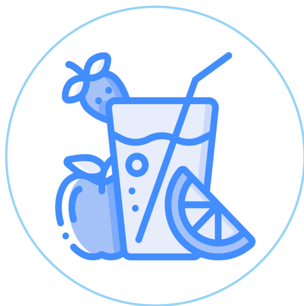
Coffee & drinks